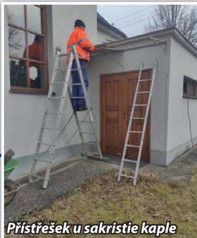
Přístřešek u sakristie kaple