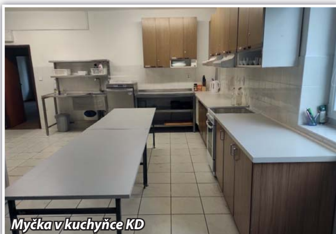
Myčka v kuchyňce KD