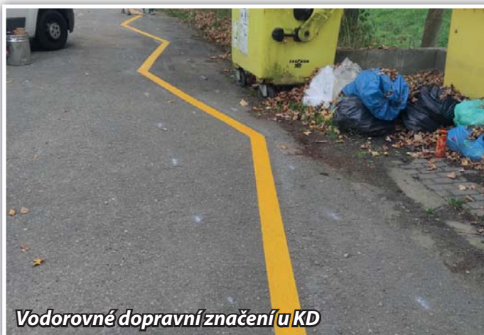
Vodorovné dopravní značení u KD