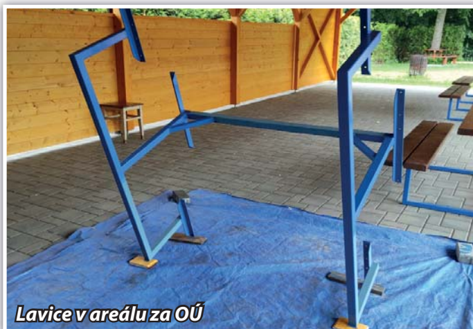
Lavice v areálu za OÚ