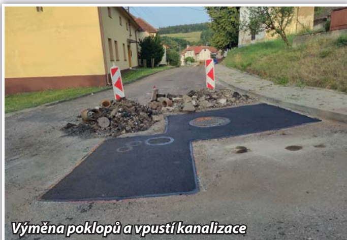
Výměna poklopů a vpustí kanalizace