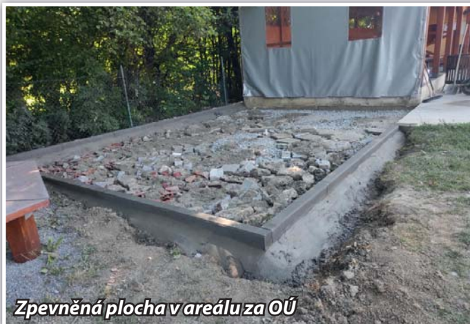
Zpevněná plocha v areálu za OÚ