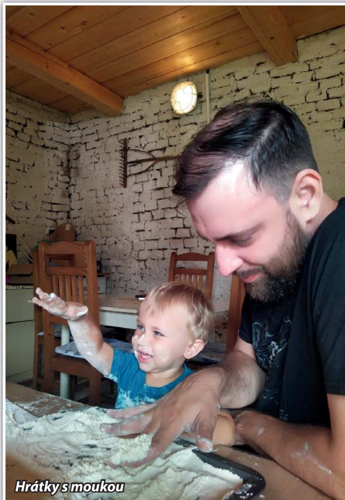
Hrátky s moukou