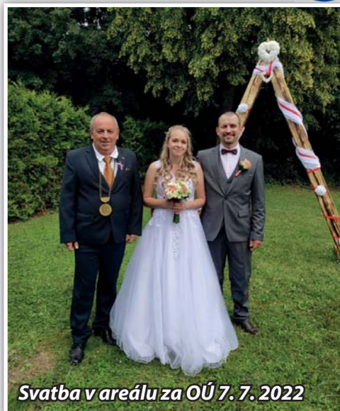
Svatba v areálu za OÚ 7. 7. 2022