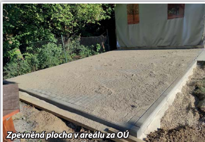
Zpevněná plocha v areálu za OÚ