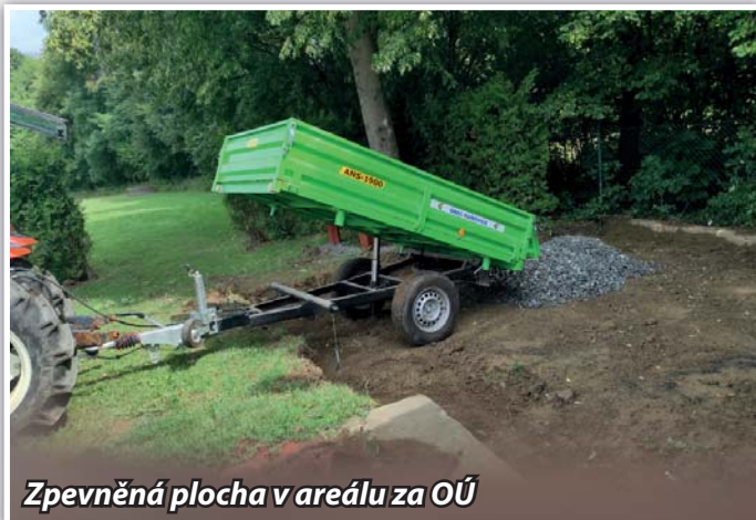
Zpevněná plocha v areálu za OÚ