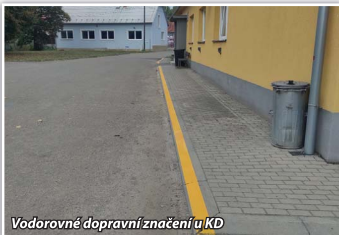
Vodorovné dopravní značení u KD