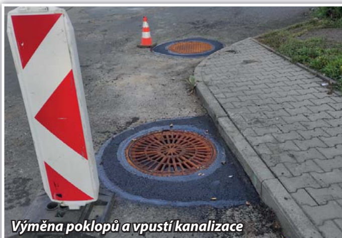
Výměna poklopů a vpustí kanalizace