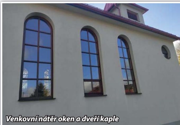
Venkovní nátěr oken a dveří kaple