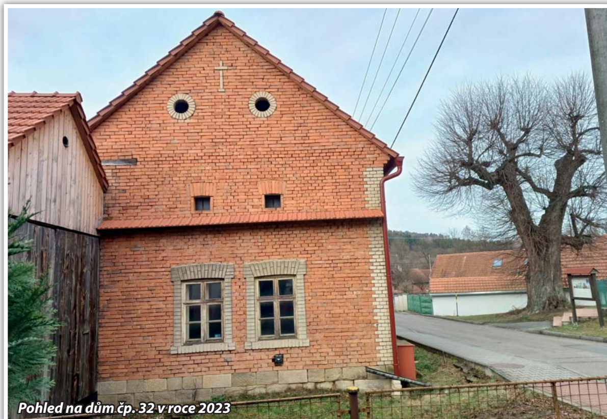
Pohled na dům čp. 32 v roce 2023

Kaňovický zpravodaj – vychází nepravidelně, ročník 21, číslo 1.