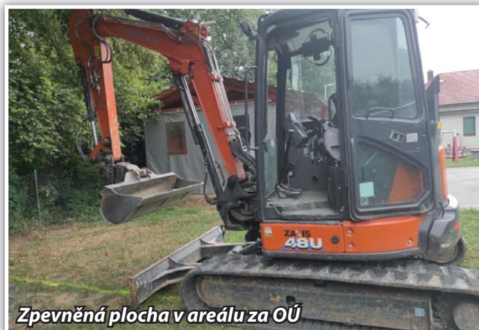
Zpevněná plocha v areálu za OÚ