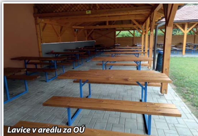
Lavice v areálu za OÚ