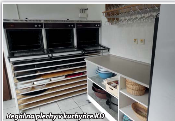
Regál na plechy v kuchyňce KD