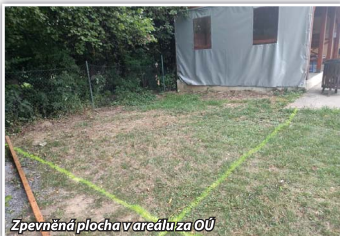
Zpevněná plocha v areálu za OÚ