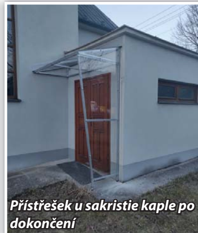
Přístřešek u sakristie kaple po dokončení