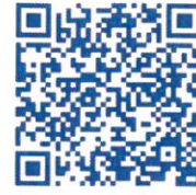
Aplikace pro Android

V přechodném období očekáváme na pobočkách fronty a přetížené telefonní linky. Pokud nebudete mít možnost nebo z nějakého důvodu nebudete chtít využít online podání žádosti o superdávku, můžete případně využít tzv. asistované podání na našich pobočkách.